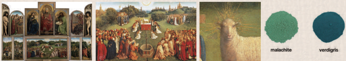
Ghent Altarpiece, Jan van Eyck, Hubert van Eyck, 1432

녹색은 성경에서 직접적으로 강조되는 색은 아니지만, 생명과 회복의 이미지와 깊이 연결되어 있다. 흥미로운 점은, 성경에서 '녹색'을 하나의 단어로 고정해서 쓰지 않고 풀과 나무, 그리고 생명의 상태를 통해 간접적으로 표현한다는 것이다. 예를 들어, 히브리어로 '데쉐(דֶשֶׁת)'는 풀과 새싹을 의미하며, 이는 시편 23장 2절의 “그가 나를 푸른 풀밭에 누이시며”라는 구절에 쓰인 단어이다. 무성한 푸르름을 뜻하는 '리아난(רִיאָנָן)'이라는 단어도 녹색을 나타내는 데에 종종 사용되었다. 성화에서 녹색 안료는 주로 구리 탄산염 광물에서 나온 '말라카이트(Malachite)'로 제작하였고, 구리 녹에서 생성된 '베르디그리스(Verdigris)' 안료도 널리 쓰였다고 한다. 다만, 구리에서 추출된 녹색은 시간이 지나면서 갈색으로 변색되어 오늘날 우리가 마주하는 작품들의 녹색은 다소 탁하게 보일 수 있다. 성화에서 녹색은 주로 낙원과 초원을 상징하며, 북유럽 르네상스 회화의 대표 걸작인 안반 에이크의 <젠트 제단화>에서는 중앙 패널에 선명한 녹색 초원을 그려 넣어 구원 이후의 세계를 표현했다. 제단 위의 어린 양은 희생한 예수 그리스도를 상징하며, 그의 구원과 부활의 생명력을 끝없이 이어지는 초원을 통해 나타냈다. 또한, 이러한 녹색 배경은 고요하고 신성한 분위기를 강조함과 동시에, 신학적 메시지의 기반이 되는 역할을 한다고도 볼 수 있다.