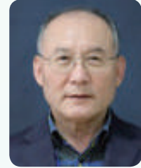
우 중 화 원로장로 (제3남선, 기드온속)

제 신앙 의 여정은 긴 산을 오르는 일과 같았습니다. 저희 세대가 대부분 그렇듯이 굴곡진 세월을 살아온 탓입니다. 제 신앙생활은 1.4후퇴 때 피난 나온 아버지께서 전라도 시골 마을에 세운 작은 교회에서 시작되었습니다. 황해도에서 감리교 집사였던 아버지는 전남 동부지역 최초로 감리교회를 세우셨습니다. 성전을 건축하고 감리교 전도사님을 청빙하고 교회를 유지하는 모든 일이 아버지의 가장 중요한 사명이었습니다. 아버지는 감리교 신앙에 대한 자부심이 대단하셨습니다. 가까운 장로교회에 나갈 수도 있었을텐데, 그러면 그 많은 짐을 지지 않아도 되셨을텐데, 자신이 자라온 감리교 신앙과 크게 다름을 느끼고 스스로 감리교회를 세우셨습니다. 아버지의 감리교 자부심은 거기서 그치지 않았습니다. 일제강점기 감리교 계몽운동의 혜택을 받으신 터라 감리교회는 이웃을 섬겨야 한다며 야학을 여시고 선생님들을 모집해 학교에 가지 못하는 동네 아이들을 가르치셨습니다. 아버지는 평신도이면서도 남다른 헌신을 실천하셨습니다.