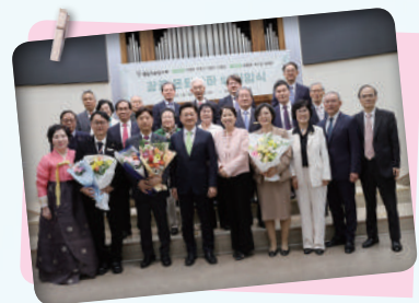
2026.4.5.(부활주일) 오후 2시, 장로 은퇴찬하 및 취임식